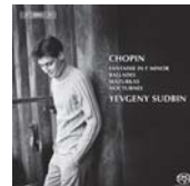
ショパン： 幻想曲/バラード第 3 番; 第 4 番/ノクターン Op.27 の 1; Op.48 の 1; Op.55 の 2/マズルカ Op.7 の 3; Op.33 の 2, 4; Op.24 の 4; Op.50 の 3/スドビン：小犬のワルツ・バラフレーズ BIS SA.1838 (SACD HYBRID)