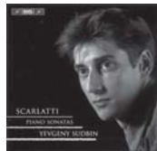
スカラッチェ：ソナタ集 (全 18曲) BIS.1508

お問い合わせ 03-3945-2333 輸入・販売元： (株) キングインターナショナル